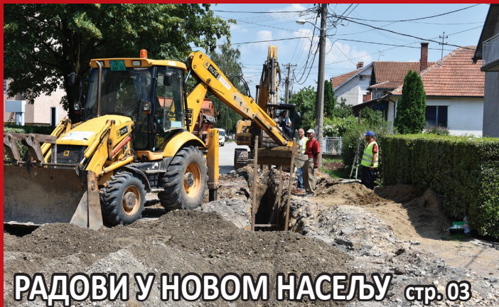
РАДОВИ У НОВОМ НАСЕЉУ стр. 03