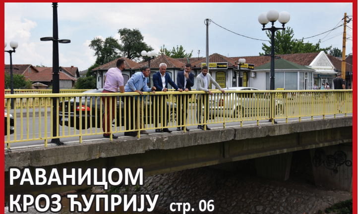
РАВНИЦОМ КРОЗ ЋУПРИЈУ стр. 06