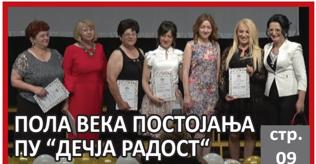
ПОЛА ВЕКА ПОСТОЈАЊА ПУ "ДЕЧЈА РАДОСТ"