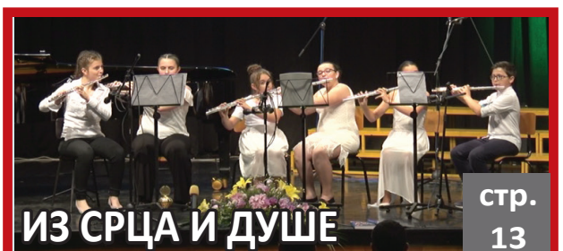
ИЗ СРЦА И ДУШЕ